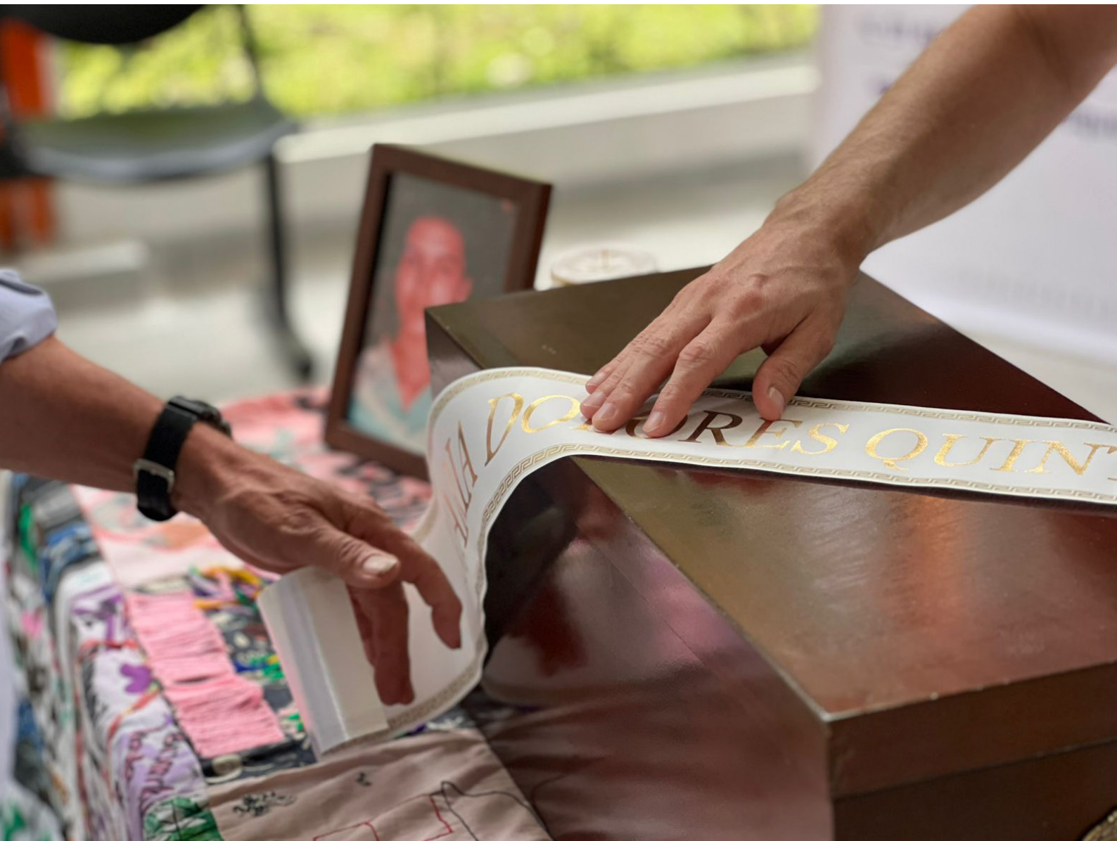
Foto 6. Entrega digna de mujer desaparecida. Municipio de San Carlos, 2024