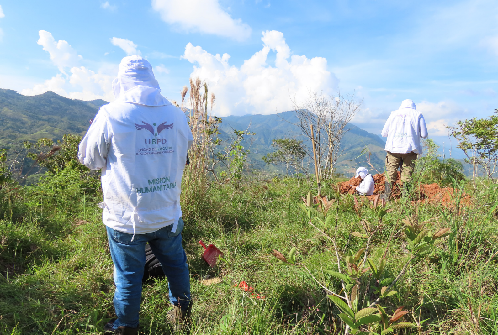
Foto 4. Registro de campo en tareas de prospección a campo abierto. Intervención en zona rural de Granada, 2024

Las rutas de la desaparición de combatientes y militantes pertenecientes a agrupaciones armadas no son fáciles de rastrear. La clandestinidad de su actuar en dichas estructuras, la poca información conocida por familiares y la dificultad para relacionar alias de guerra con identidades son problemáticas frecuentes. No ha sido extraño hallar que un número considerable de CNI en cementerios eran actores vinculados al conflicto armado. Se documentaron casos a partir del trabajo focal con exmilitantes de las estructuras o el cruce de datos dispersos en documentos confidenciales. Intervenciones en los cementerios de El Santuario ( El Colombiano , 2023), San Rafael y Cocorná centraron la atención en este