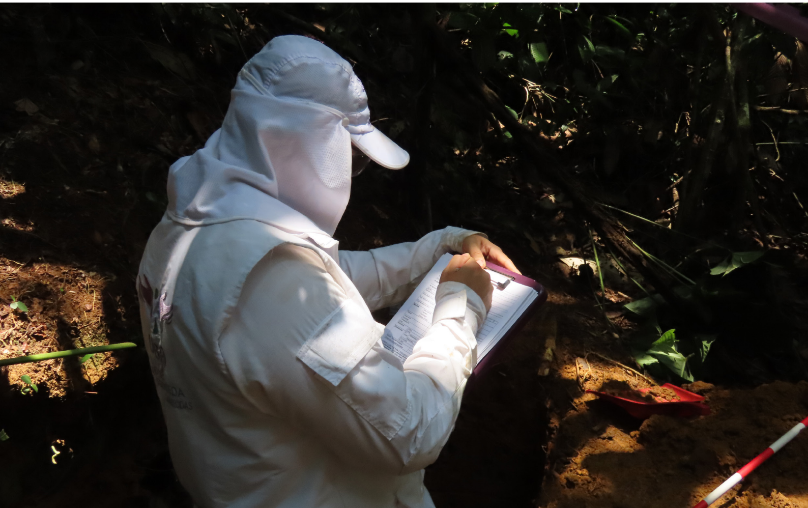
Foto 1. Investigador en registro de campo. Intervención en zona rural de Granada, 2024

de edad integrados a las filas de las estructuras armadas. Nuevamente, el oriente antioqueño ocupa uno de los primeros puestos en hechos de niños y niñas asesinados y ocultados en zonas rurales, con pocas posibilidades de ser hallados y entregados a sus familias. Las metodologías de búsqueda, además de las acciones de investigación historiográfica con el trabajo de fuentes orales y documentales, exploran los saberes de la arqueología forense. Otras experiencias de los integrantes de las organizaciones armadas terminaron en desapariciones en medio de las hostilidades, fenómeno se estudia en una tercera línea de investigación que reconstruye las trayectorias de quienes participaron en el conflicto, fallecieron en distintos hechos y sus cuerpos no fueron entregados dignamente.