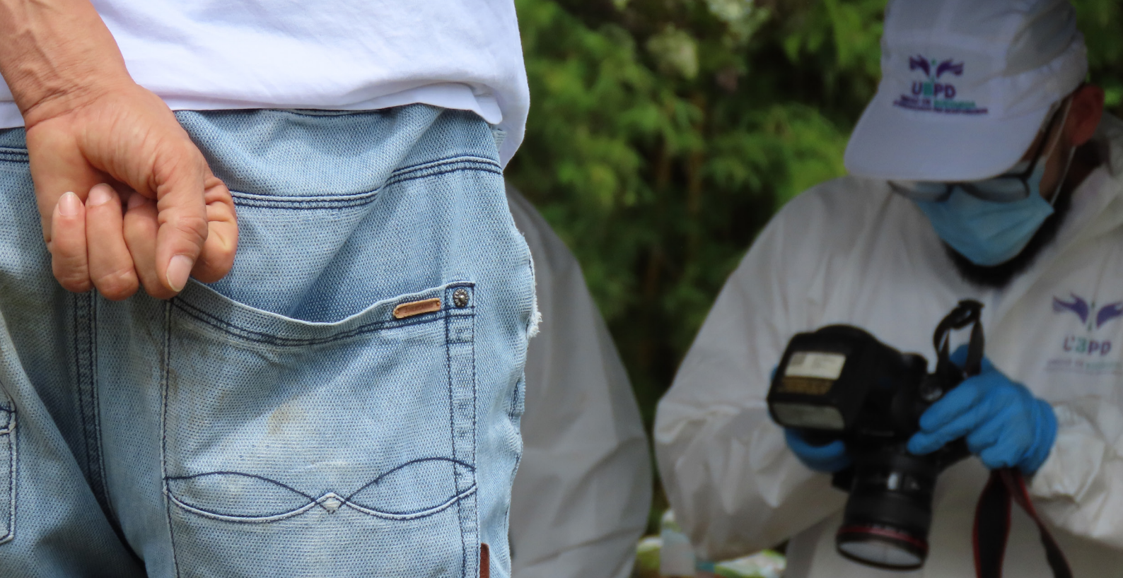
Foto 3. Investigador durante intervención del cementerio de San Luis, 2024

La Unidad de Búsqueda ha realizado su trabajo en articulación con el Comité de Apoyo a la búsqueda de las personas desaparecidas en el Oriente de Antioquia (UBPD, 2023); la Asociación Regional de Mujeres del Oriente Antioqueño (AMOR), que documentó 167 casos; la Mesa Departamental de Desaparición, Rayo de Luz, que reportó 93 desapariciones; la Corporación Región, que documentó 174 casos; la Corporación Jurídica Libertad, con un total de 41 desapariciones documentadas; la Asociación Caminos de Esperanza, Madres de la Candelaria, con 75 solicitudes de búsqueda. Igualmente, se dispuso de acciones con la Unidad para la Atención y Reparación Integral a las Víctimas, el Centro de Acercamiento para la Reconciliación y la Reparación (CARE) de San Carlos, Aulas de Paz, Reencuentros, la red de personeros del Oriente e instancias académicas como Hacemos Memoria de la Universidad de Antioquia y el Centro Nacional de