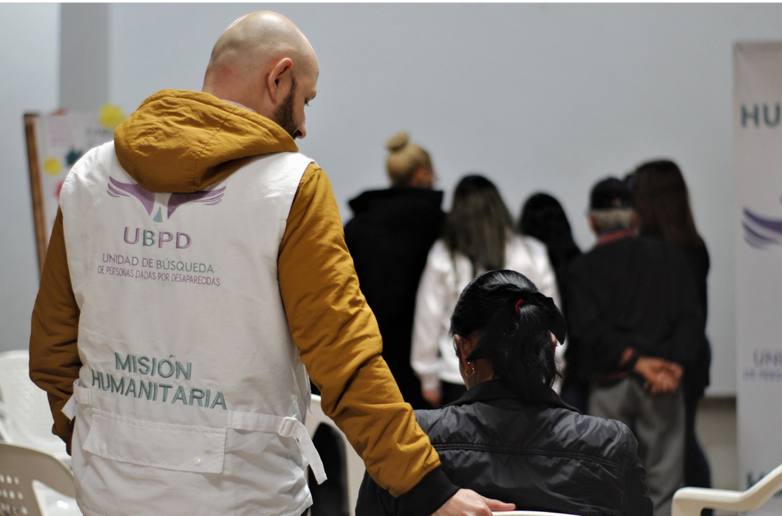
Foto 5. Investigador durante entrega digna de persona dada por desaparecida en La Unión, 2024

Medio y Nordeste de Antioquia. Es complejo determinar los paraderos de estos combatientes y militantes; no obstante, quedaron algunas investigaciones judiciales y las recuperaciones de cadáveres efectuadas por la Fiscalía General de la Nación, como se evidencia en algunos procesos de la Sala de Justicia y Paz (2016, 2019).