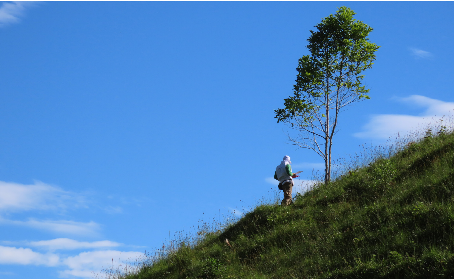
Foto 2. Registro de campo. Caracterización de sitio de interés forense en zona rural de San Carlos, 2023

En el cementerio se esperaba recuperar un estimado de 73 cadáveres, la mayoría dispuestos en bóvedas, entre el 2000 y 2008. La reconstrucción de los hechos sobre la desaparición del campesino fue adelantada por la Corporación Región (2021) en el desarrollo del proyecto Memorias de la Ausencia que, desde la sociedad civil, documentó desapariciones en los municipios de San Rafael, Granada, Sonsón, Argelia y Nariño, principalmente. Anteriormente, los avances de la justicia en la búsqueda, tras años de pesquisa, habían dado lugar al mismo hallazgo de la prótesis.