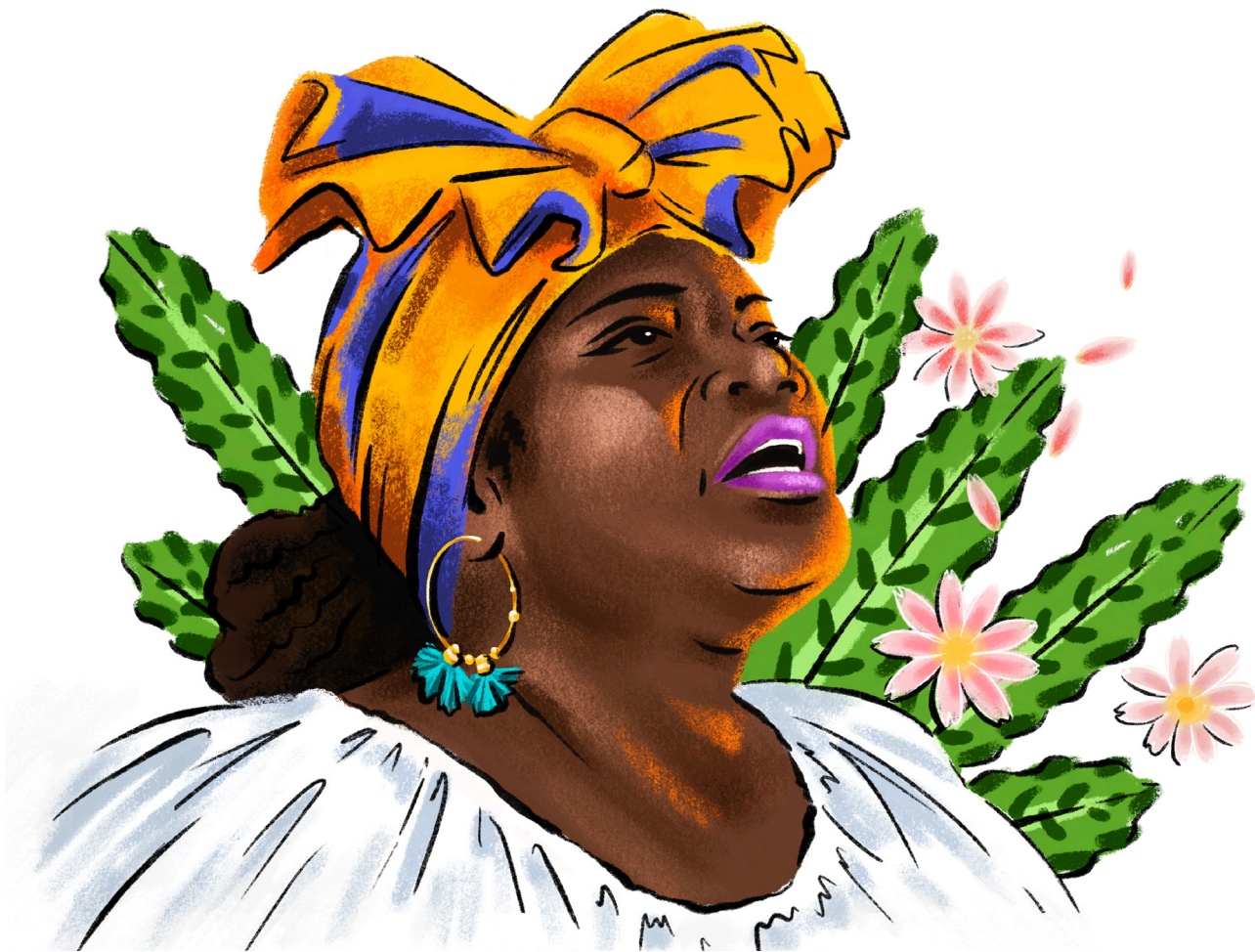
Ilustración: Camilo Andrés Ruiz Páez