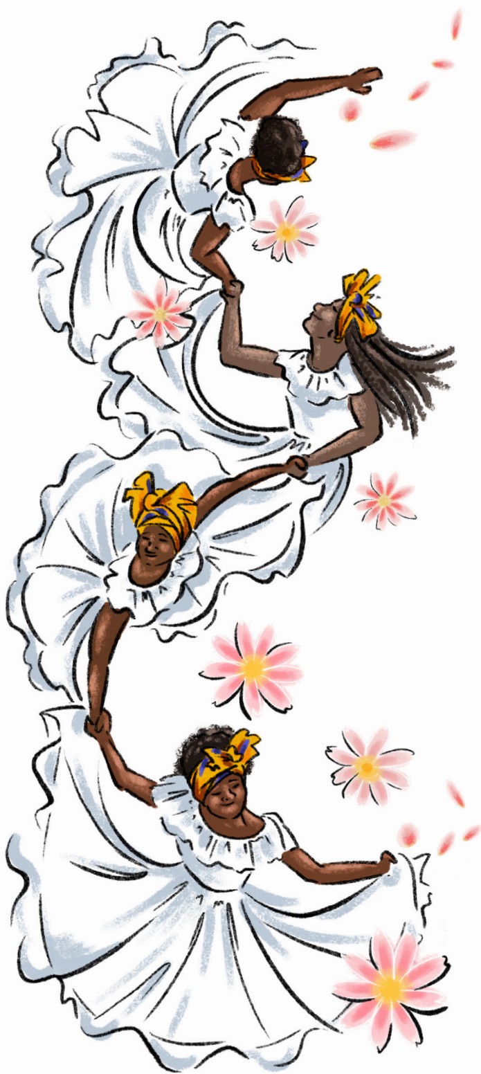
Ilustración: Camilo Andrés Ruiz Páez

unas mujeres con otras sino en objetivos políticos y éticos” (p. 146). En este caso, dichas acciones se centran en la búsqueda de sus seres queridos, la visibilización de la desaparición forzada, la exigencia por la garantía de sus derechos y la construcción de un espacio seguro y de cuidado.