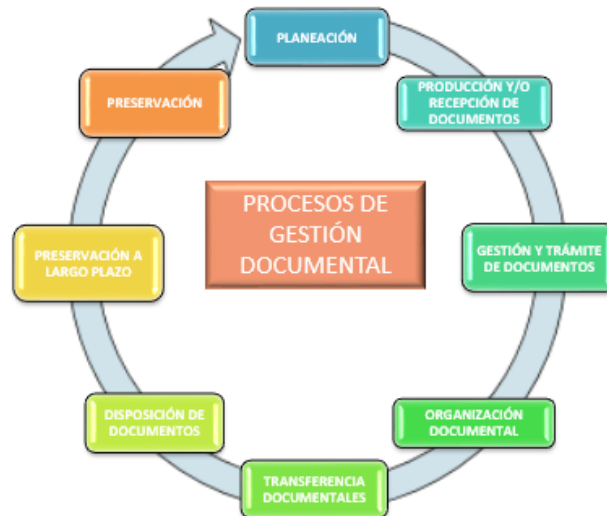
Figura 1 – Procesos de la Gestión Documental

De acuerdo con lo establecido en el Decreto 1080 de 2015, la gestión documental abarca ocho (8) pasos o procesos (Planeación, producción, gestión y trámite, organización, transferencias, disposición de documentos, preservación a largo de plazo, valoración), en la UBPD se han efectuado algunos avances significativos en la implementación del proceso que serán enunciados durante el desarrollo de este documento, incluyendo las metas que en el corto, mediano y largo plazo se deben asumir para lograr una gestión documental normalizada y que de cuenta efectiva de la gestión pública en términos de transparencia, evidenciada en sus documentos e información.